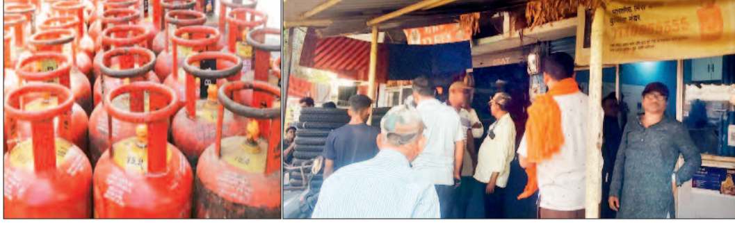
हरिभूमि न्यूज | बेमेतरा

प्रशासन का दावा-पर्याप्त स्टॉक, उपभोक्ता परेशान, बुकिंग नहीं होने से एजेंसियों में कतारें